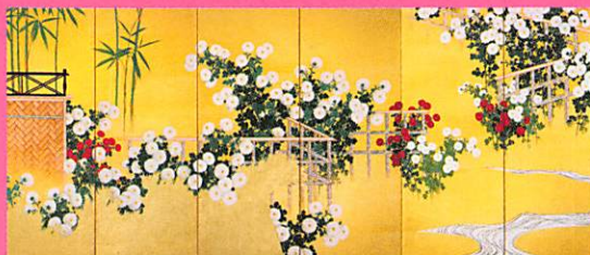
〔国之華〕大正13年(1924) 紙本金地着色 皇居三の丸尚蔵館 【前期】特別出品