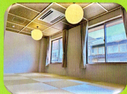
ショートステイ 下茶屋の庵

要介護度3～5で、ご家庭での介護が必要になった方に食事・排泄・入浴等の日常生活全般における介護サービスを提供いたします。10名のご入居者様と各ユニットの職員が1つのユニットで生活を共にし、お一人おひとりの生活をサポートします。