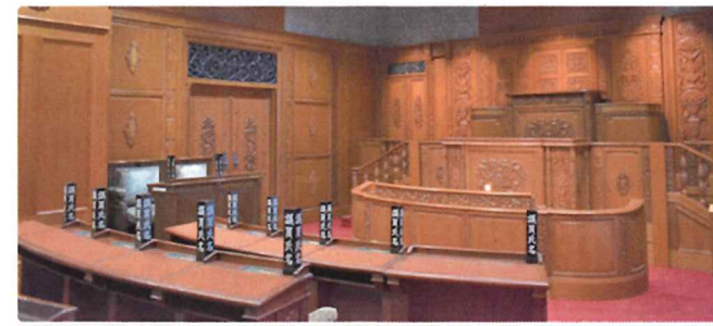
議場体験コーナー