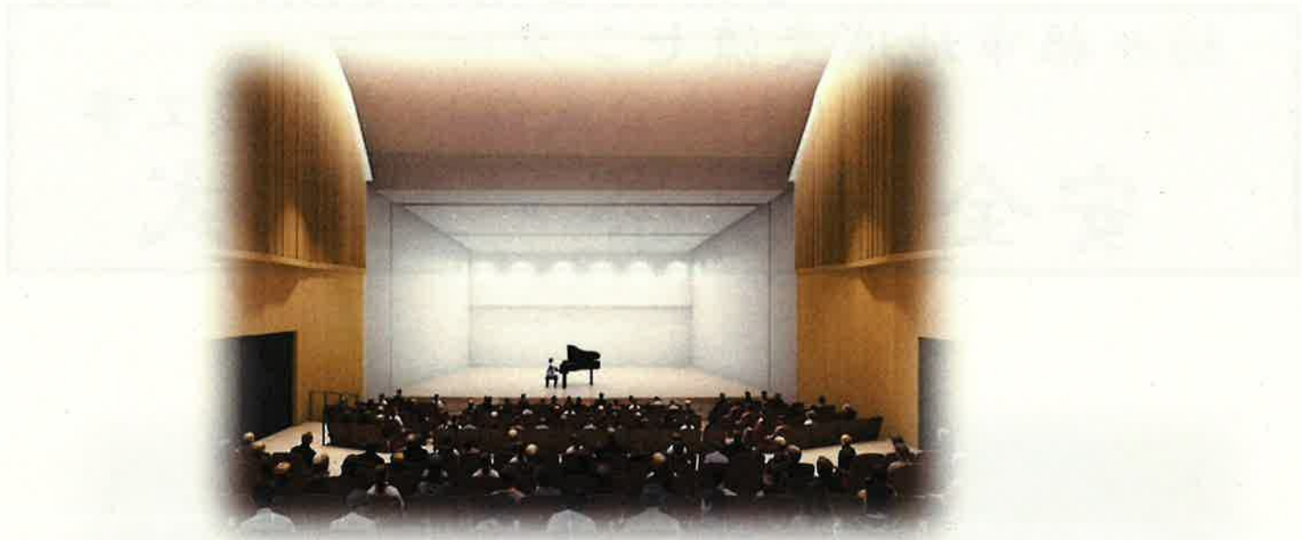
公民館 講堂 イメージ